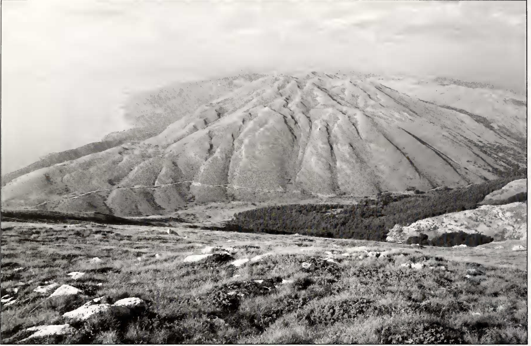
Fig. 4. Locality Lako Signoj.